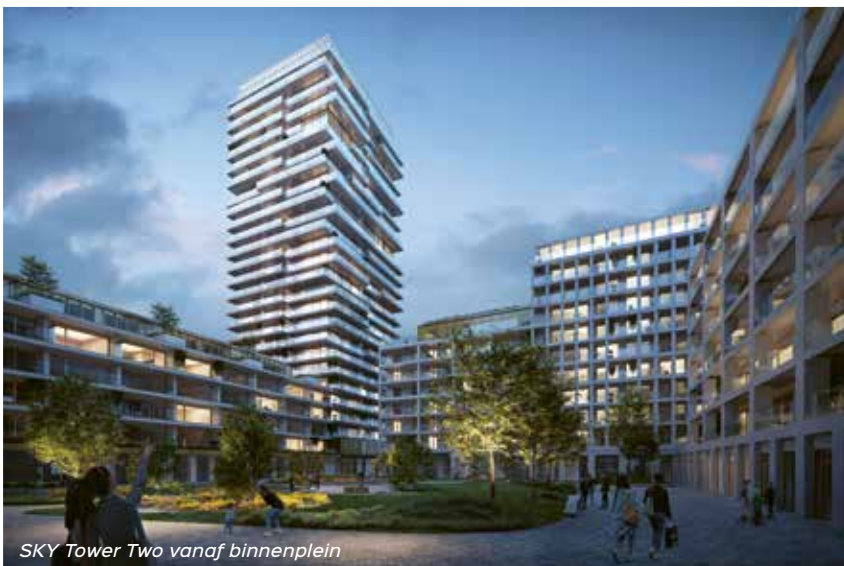
SKY Tower Two vanaf binnenplein

“Het voorspoedig verloop van dit project, zowel wat betreft de uitvoering als de verkoop, stelt ons in staat om alles in een stroomversnelling te realiseren. Tegen deze zomer is het volledige voorplein langs de Leopold III laan toegankelijk en worden de nieuwe kantoren van Vastgoedgroep Degroote in gebruik genomen. Aansluitend gebeurt de oplevering van het binnenplein en tegen eind 2022 worden de eerste 200 appartementen opgeleverd. Zes maanden later vindt de oplevering van de volgende 2 residenties plaats, samen goed voor 130 bijkomende units. Tegen de zomer van 2025 zijn zowel de tweede toren, het hotel en de resterende pleinen langs de Oesterbankstraat en de Brandariskaai afgewerkt. Dankzij het verkeersvrije omgevingskarakter en de beeldbepalende architectuur die SKY Towers kenmerkt, kunnen de bewoners en omwonenden de komende jaren ongetwijfeld genieten van deze fonkelende diamanten die schitteren aan de vastgoedkroon van Oostende.