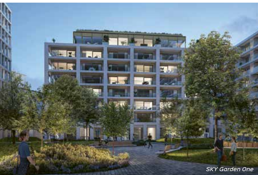
SKY Garden One