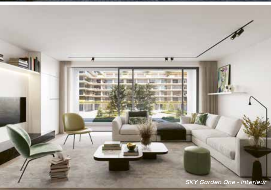
SKY Garden One - Interieur