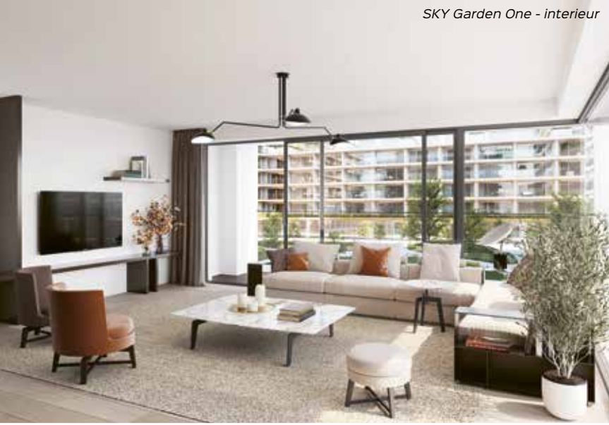
SKY Garden One - interieur