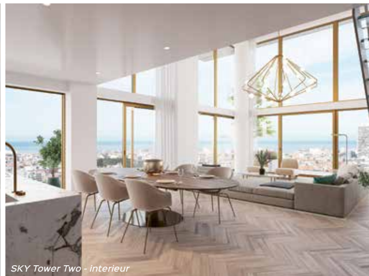
SKY Tower Two - Interieur