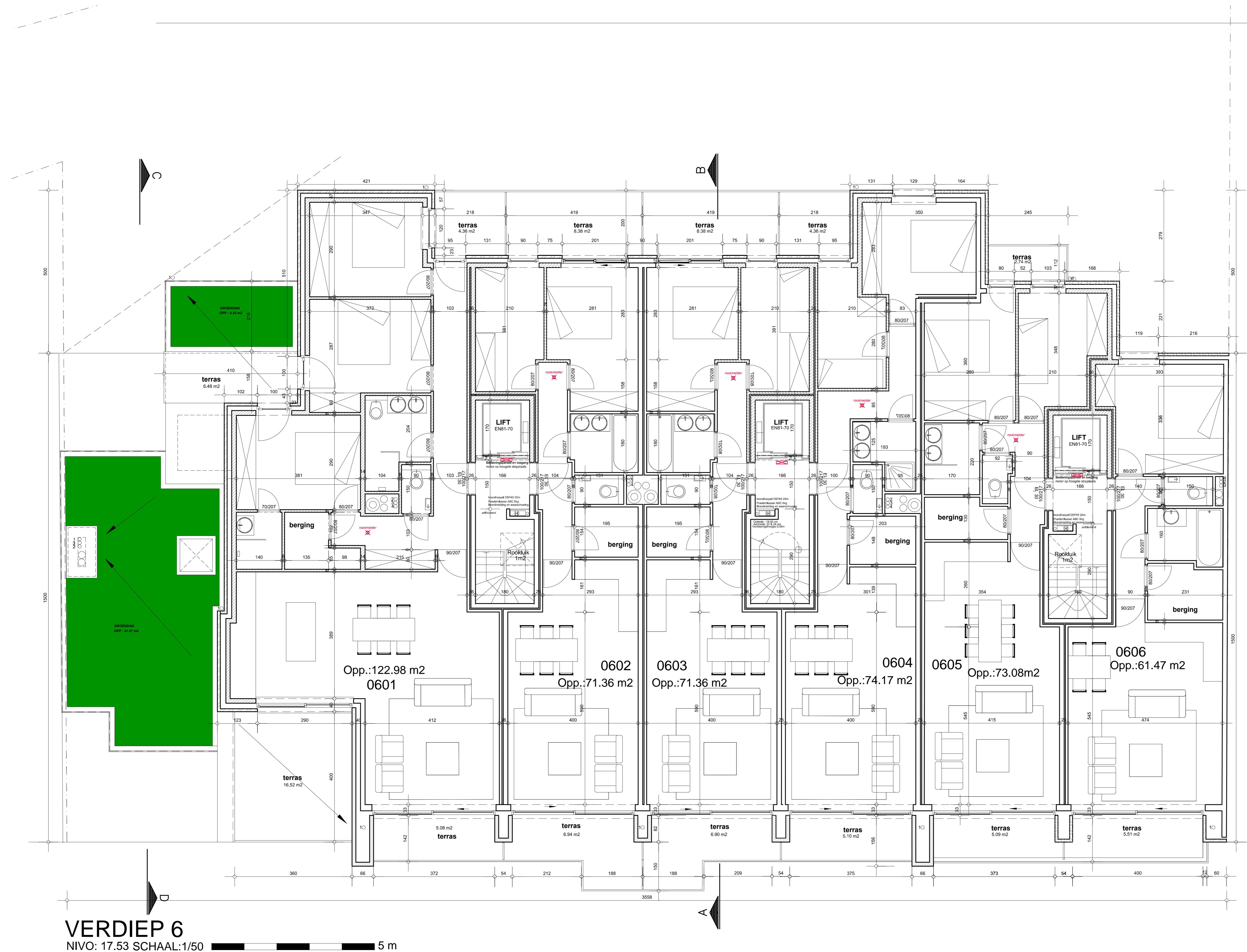
VERDIEP 6 NIVO: 17.53 SCHAAL:1/50

FUNDERING EN STABILITEITSELEMENTEN of GEGEVENS IR. STABILITEIT