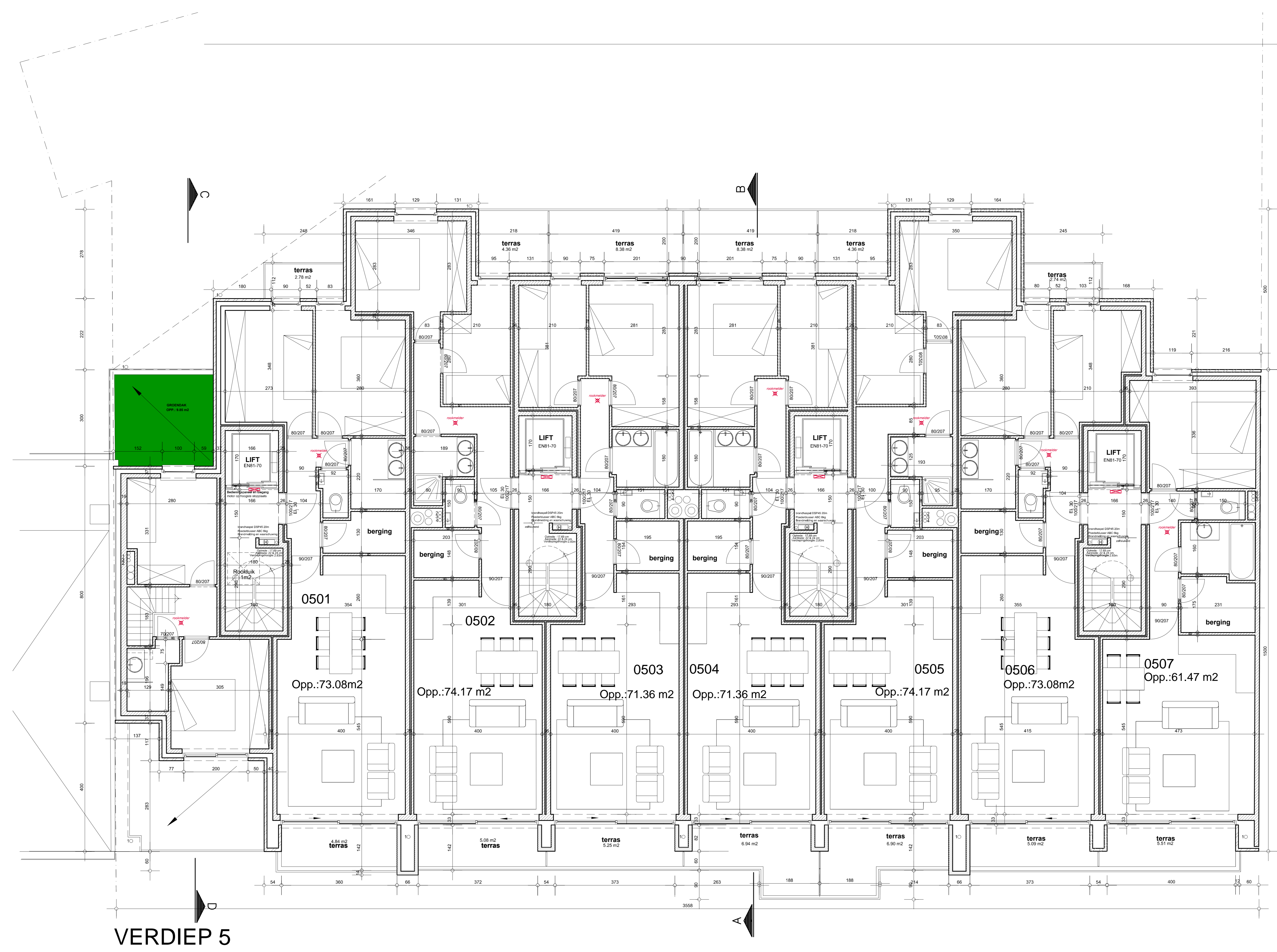
VERDIEP 5 NIVO: 14.70 SCHAAL: 1/50 5 m

FUNDERING EN STABILITEITSELEMENTEN cfr. GEGEVENS IR. STABILITEIT