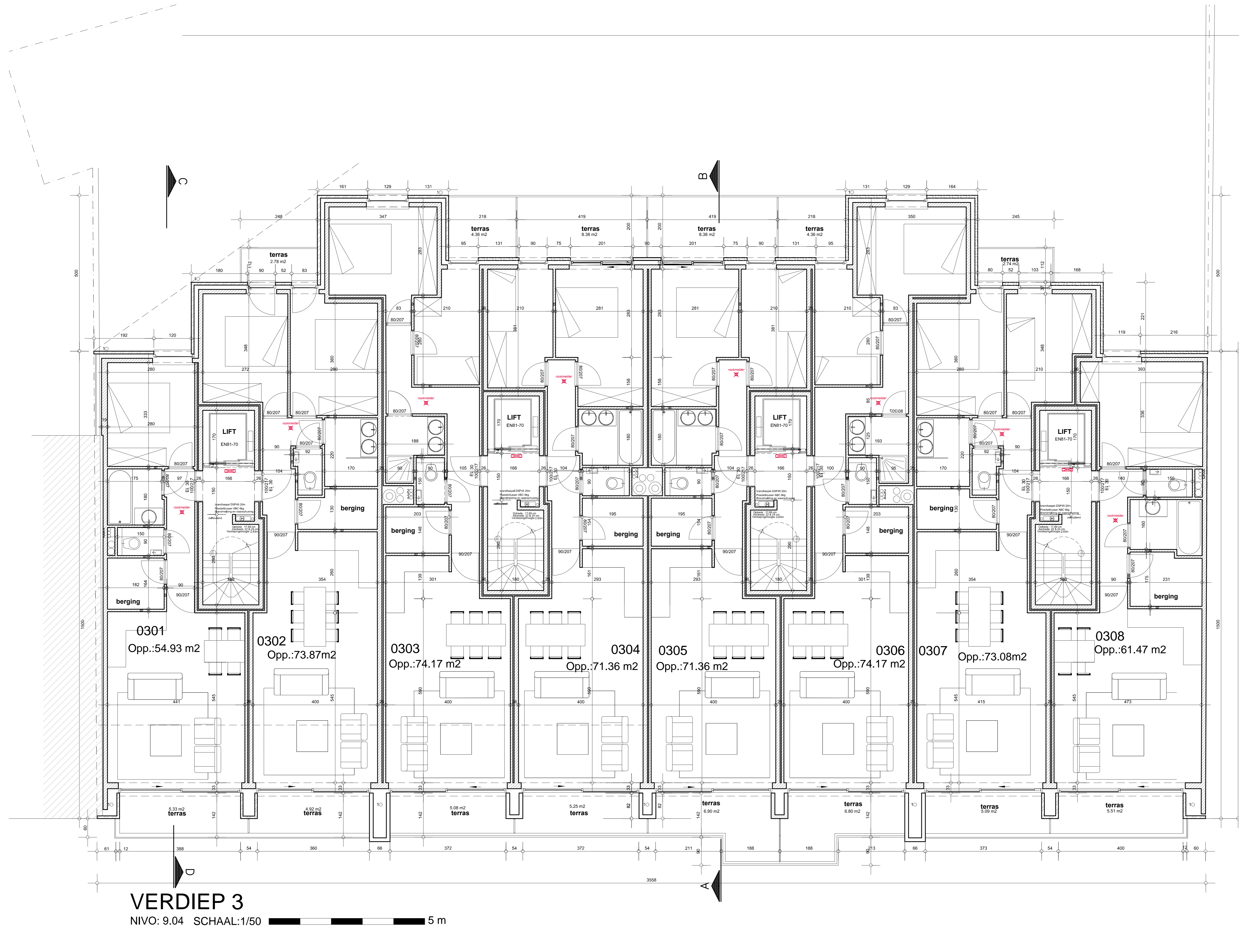
VERDIEP 3 NIVO: 9.04 SCHAAL: 1/50

FUNDERING EN STABILITEITSELEMENTEN of: GEGEVENS IR, STABILITEIT