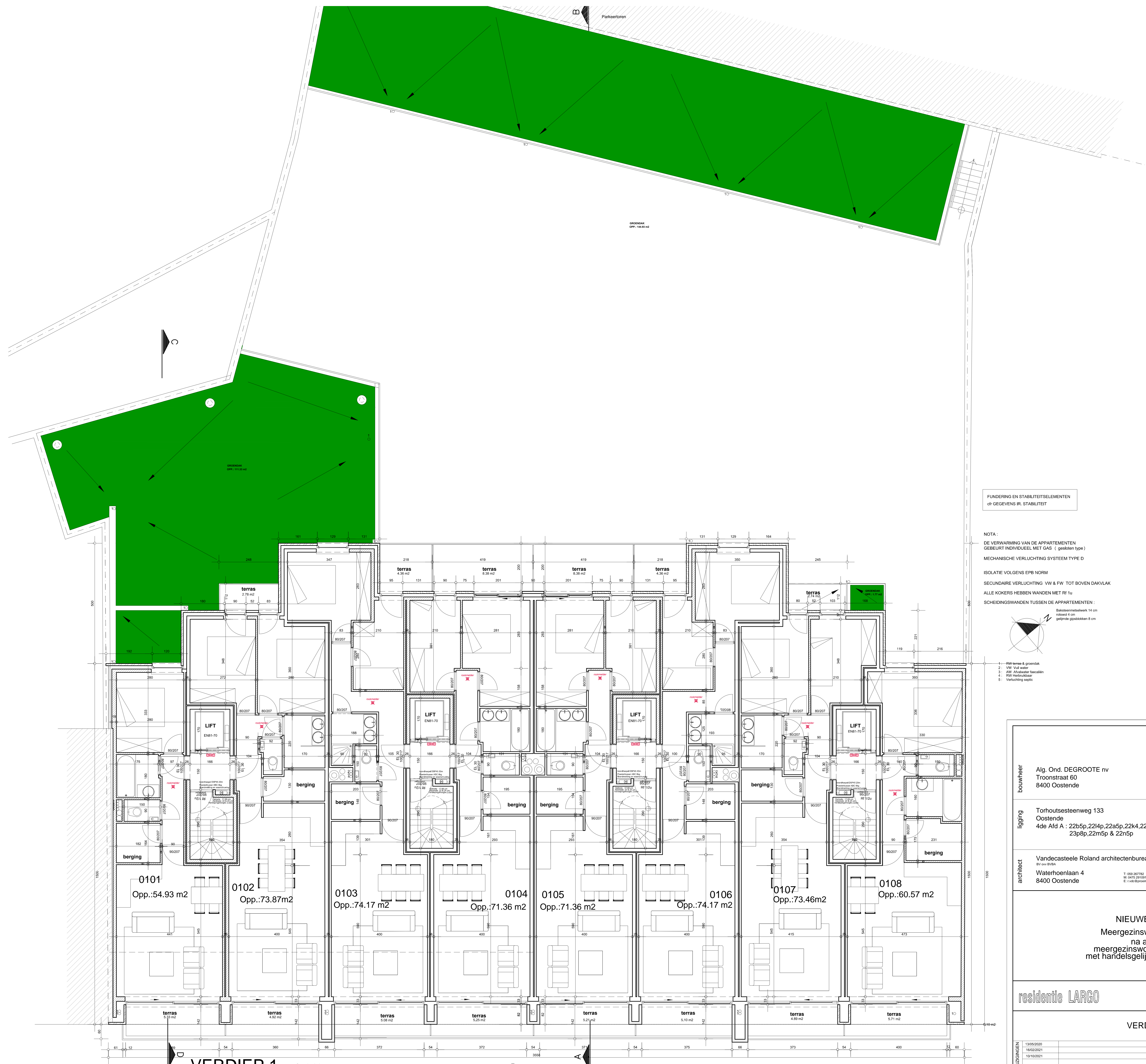
VERDIEP 1 NIVO: 3.38 SCHAAL:1/50 5 m

FUNDERING EN STABILITEITSELEMENTEN OF GEGEVENS V. STABILITEIT